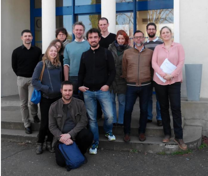
L'équipe du Lycée Ste Croix – Le Mans et les comédiens

« Les Raccrocheurs », intervention théâtrale, a été créée le 5 avril 2017 au Lycée Saint Charles - Sainte Croix au Mans (72)