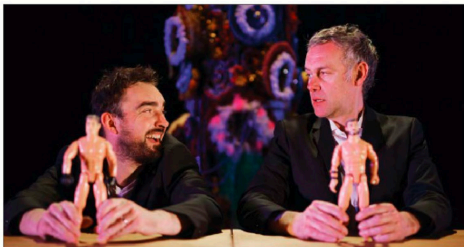
La troupe Groupe déjà interprète la pièce Cow-boy ou indien au théâtre de l'Archipel, le 10 janvier.

■ Pratique. Théâtre l'Archipel. Mardi 10 janvier, à 20h 30. A partir de 10 ans. Renseignements et réservations: tél. 02 33 69 27 30 ou billetterie@archipel-granville.com