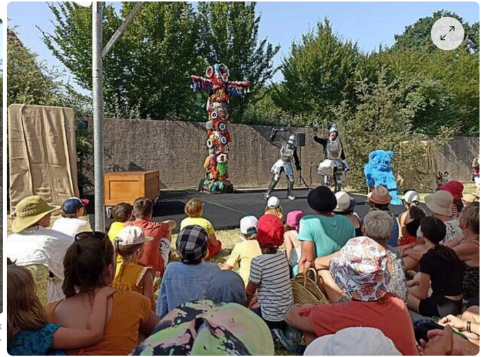
« Cowboy ou Indien ? » Ça a démarré très fort avec des chevaliers sublimes et patauds dans leurs armures utilisées ! OUEST-FRANCE

Les artistes aiment les Zendimanchés. Les festivaliers, eux-aussi, aiment les artistes ! Ils se disent les bons rendez-vous à ne pas manquer. « Il ne faut pas rater Cowboy ou Indien ? », préviennent-ils par exemple. « Une perle théâtrale ! » qui était à l'affiche de la 24 e édition du festival d'arts de rue qui s'achève ce dimanche soir 17 juillet à Saint-Hilaire-de-Chaléons .