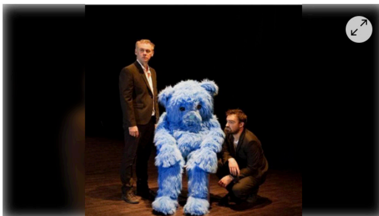
Le duo Déjà se mettra en scène samedi à la maison des habitants de Bauné avec un théâtre de rue : « Cow-boy ou Indien ? ». |

La commune de Loire-Authion, en partenariat avec le centre social et l'Association d'animation et d'initiatives citoyennes Loire Authion (Aicla), proposera samedi, en extérieur, le spectacle « Cow-boy ou indien ? »