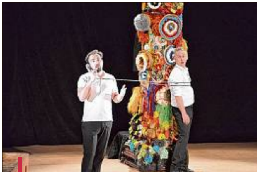
Une histoire simple, où deux frères retracent des événements survenus dans leur vie d'enfant, d'ado, ou d'adulte.