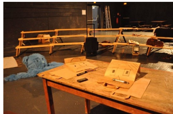
Au sol, un corps inerte, celui d'un gros nounours bleu, allégorie de l'enfance de deux frères, de leurs peurs, de leurs contrariétés, de leurs rancœurs.