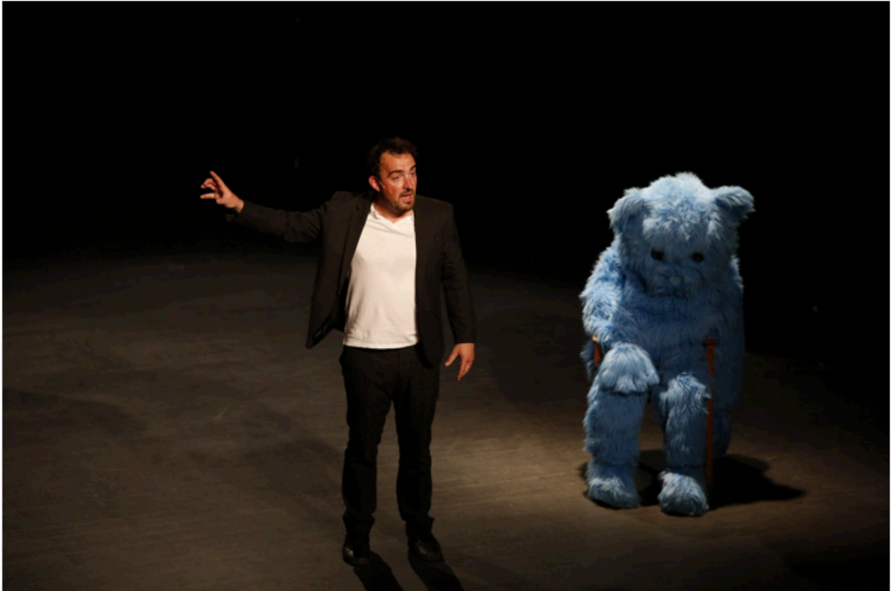
Service culture Ville des Herbiers (85) - 4 mai 2022