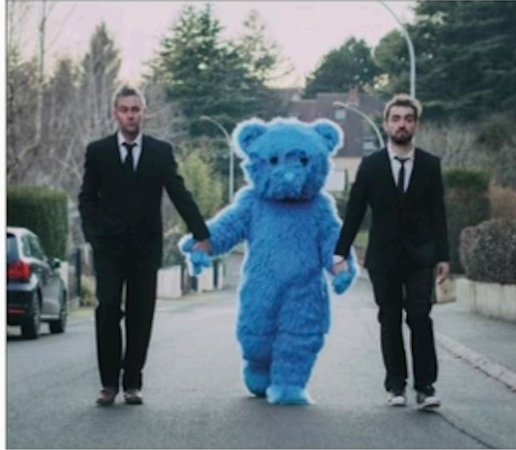
Cowboy ou indien ? , « un spectacle où l'on s'amuse, on rit, on pleure... avec beaucoup de fond ».

« Nous sommes deux frangins sur scène et ce totem de quatre